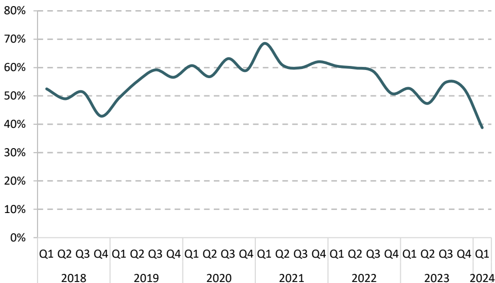
Figur 2: Bruttomarginal, kvartalsvis

Bruttomarginalen påverkades negativt av produktmixen, där lager 2-produkter, med generellt lägre bruttomarginaler, utgjorde en betydande del av försäljningen.